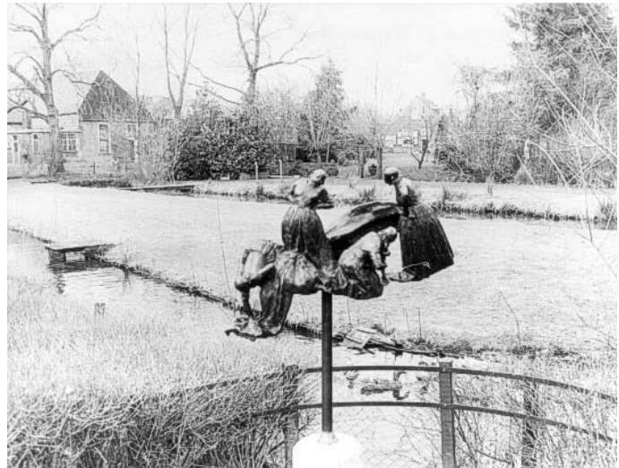
En dit is een foto van 'De Bleek' in Diepenheim

'De Bleek' is al heel oud. Vroeger wasten de mensen hier hun kleren. Dat kun je op deze foto zien. De gewassen kleren werden op het gras gelegd om in de zon te bleken. Hierdoor krijgt de 'witte' was een mooie wittere (heldere) kleur.